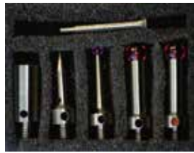
標準プローブキット