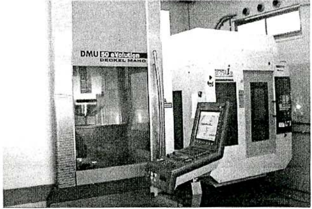
同時多軸加工可能なMCを導入。実際に加工することで、多様なニーズに対応している