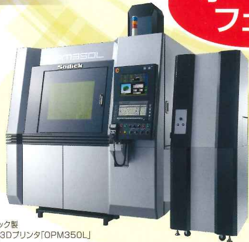
株式会社ソディック製 精密金属3Dプリンタ(OPM350L)