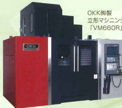
OKK(株)製 立形マシニングセンタ 「VM660R」