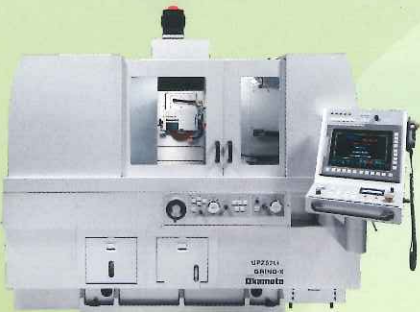
(株)岡本工作機械製作所製 CNC超精密成形研削盤「UPZ52Li」

(株)金型新聞社 (株)商工経済新聞社 (株)日刊工業新聞社 (株)ユーザー通信社