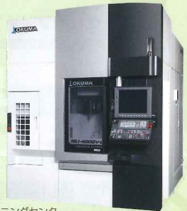
オークマ(株)製 5軸制御マシニングセンタ 「MU-4000V-L 旋削仕様」